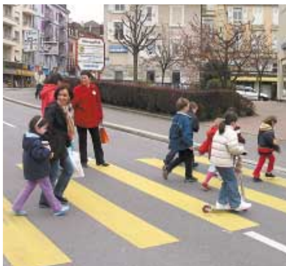
Attraversamento di un punto pericoloso.