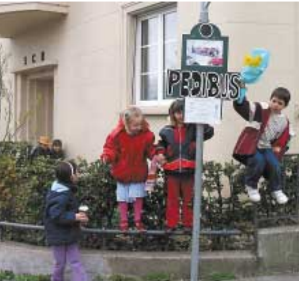
Stazione di partenza della linea.

« Il pedibus è un'ottima idea. Protegge i bambini e risolve il problema dell'accompagnamento lungo il percorso casa-scuola per i genitori. »