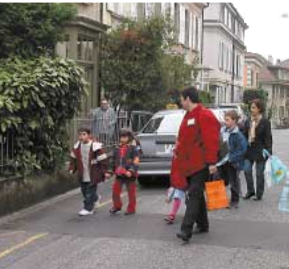
Fra una fermata e l'altra.

« Il pedibus funziona ovunque, in città come nei paesini. È un'idea brillante! »