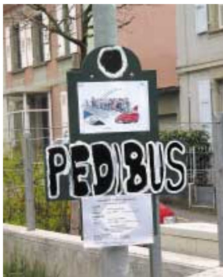
Fermata con le informazioni necessarie.