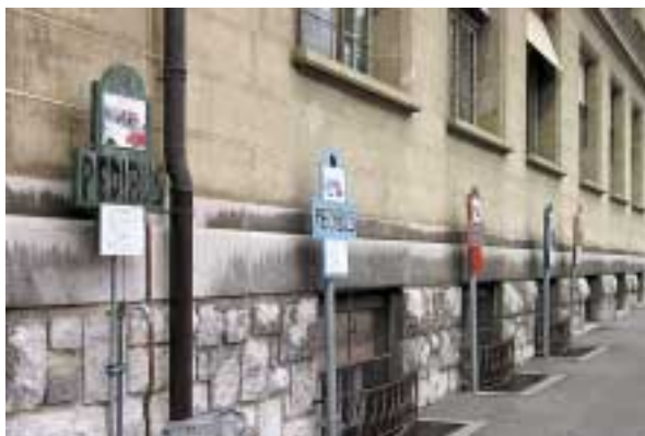
Scuola di Montriond a Losanna: cinque linee di pedibus arrivano e partono.