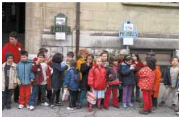
La scuola è finita. Gli allievi ritrovano la loro accompagnatrice.